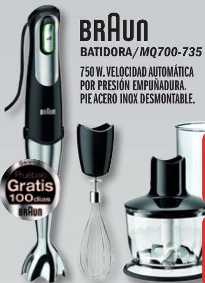
BRAUN BATIDORA/MQ700-735 750 W. VELOCIDAD AUTOMÁTICA POR PRESIÓN EMPUNADURA. PIE ACERO INOX DESMONTABLE.