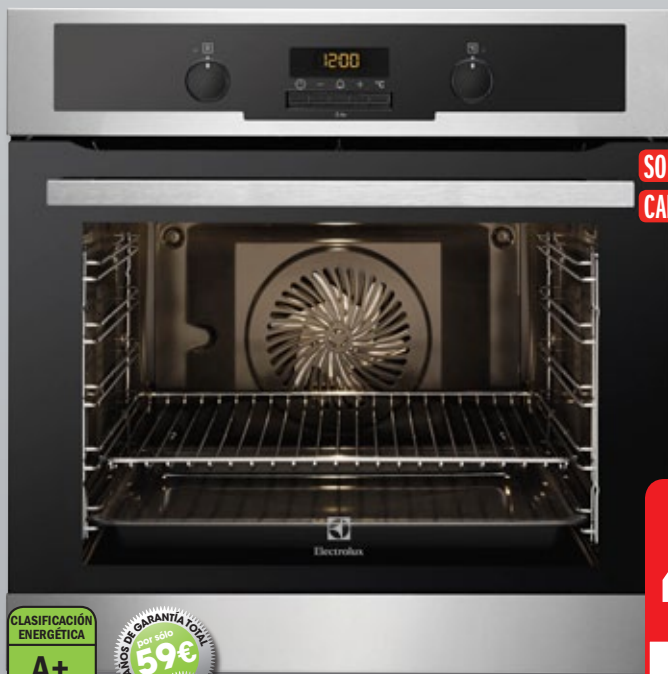
Electrolux HORNO PIROLÍTICO EOC5651BOX