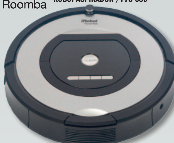
iRobot Roomba ROBOT ASPIRADOR /775-630

MOD. 775: SISTEMA LIMPIEZA IADAPT. FILTRO HEPA. SENSORES ANTICAÍDA. PROGRAMABLE. DEPÓSITO AEROVAC. 2 PAREDES VIRTUAL.