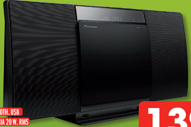
Pioneer EQUIPO MICRO SLIM/X SMC01BT-K