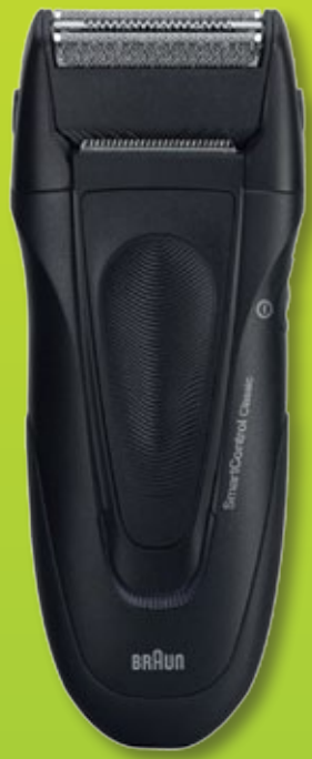
BRAUN AFEITADORA SMART CONTROL CLASSIC

RECARGABLE FUNCIONAMIENTO CON/SIN CABLE. CARGA RÁPIDA PARA 1 AFEITADO. LÁMINA SMARTFOIL. LAVABLE.