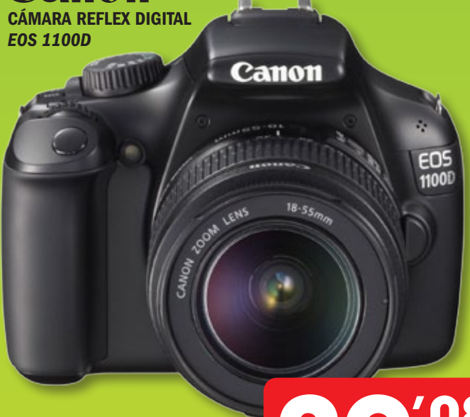
Canon CÁMARA REFLEX DIGITAL EOS 1100D