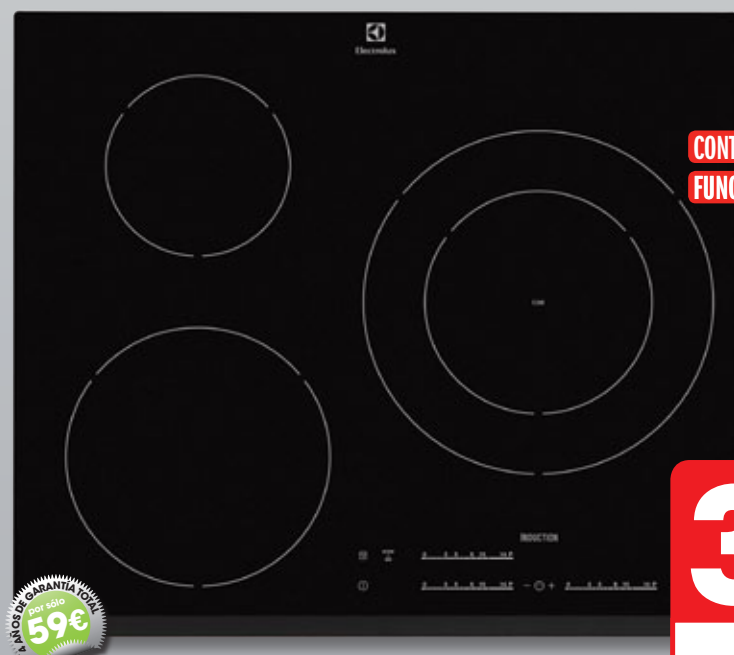
Electrolux ENCIMERA INDUCCIÓN EHM6532FOK

CONTROLES TÁCTILES DESLIZANTES FUNCIÓN STOP+GO