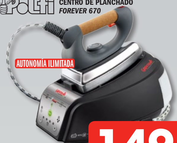
Polti CENTRO DE PLANCHADO FOREVER 670