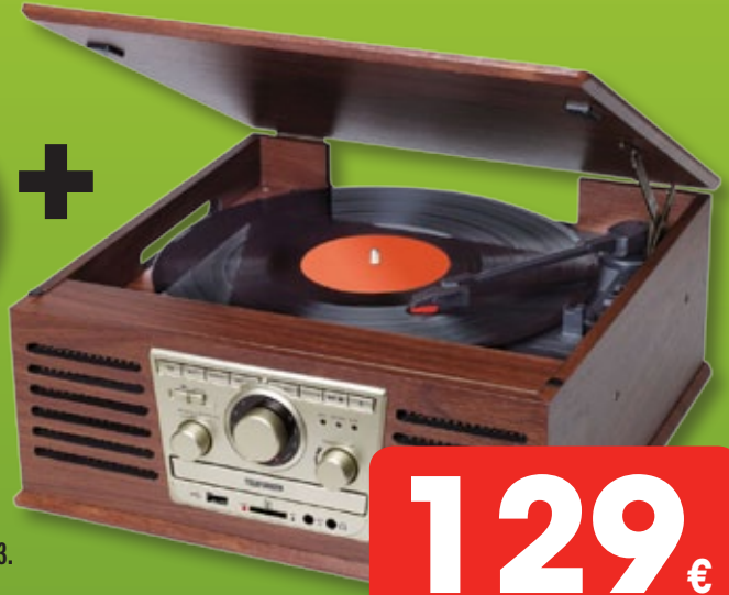
TELEFUNKEN GIRADISCOS/TCL 101

2 VELOCIDADES VINILO: 33/45 RPM. LECTOR CD/MP3. GRABACIÓN DIRECTA A USB/SD DESDE CD. ALTAVOZ INTEGRADO. SALIDA AUX IN. MANDO A DISTANCIA.