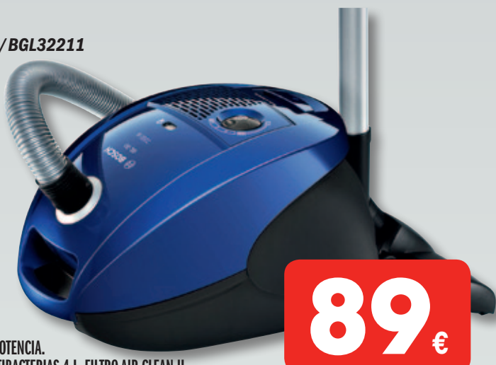
BOSCH ASPIRADOR CON BOLSA/BGL32211